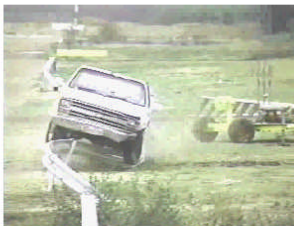
Figuras 1, 2, 3 e 4 – Ensaio de choque