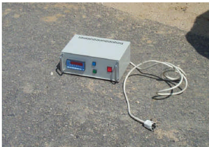
Figura 6 – Módulo electrónico de indicação