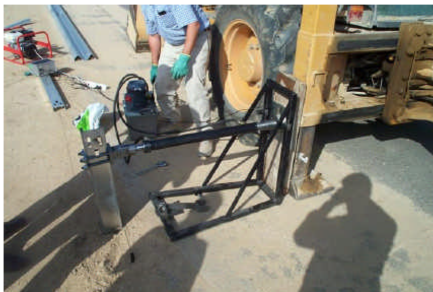
Figura 7 – Segundo passo do ensaio