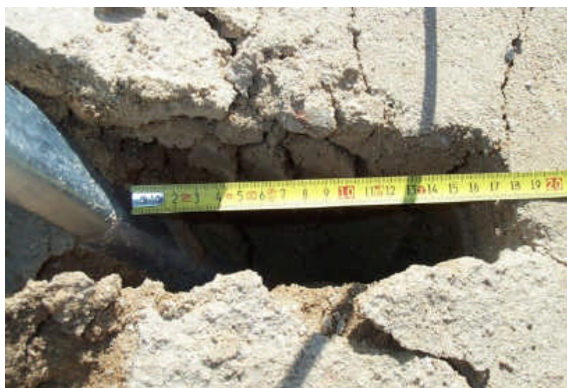
Figura 8 – Último passo do ensaio